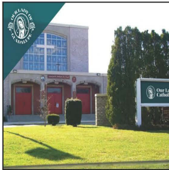
Our Lady of Guadalupe School West Campus 105 Half Hollow Rd. Deer Park, NY 11729 631-538-0505 Ext.1

Nos encantaría ayudarle! Recuerde.....Hablamos Español! Somos el mejor secreto guardado en Central Islip y Deer Park! Una escuela única con ambos idiomas cercana a tu casa