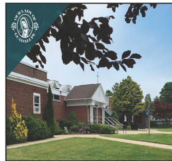
Our Lady of Guadalupe School East Campus 82 Carleton Avenue Central Islip, NY 11722 631-538-0505 Ext. 2