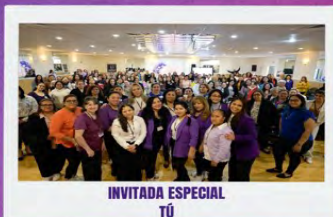
INVITADA ESPECIAL TÚ